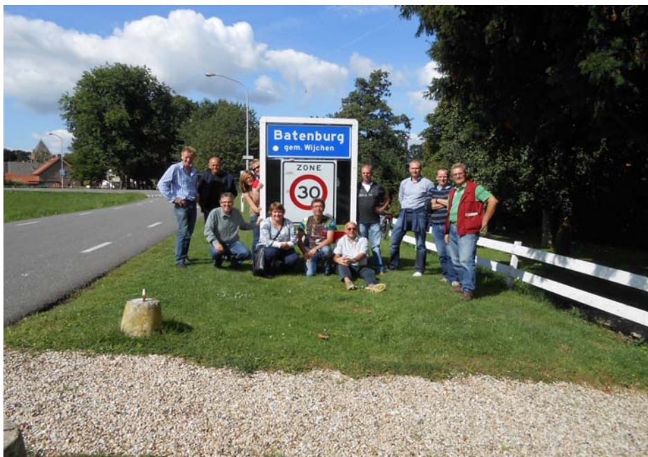
Gedeelte van de SOP Werkgroep tijdens de Stadsschouw op 1 september 2012