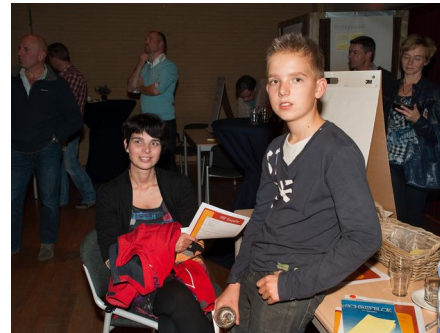
Ook de jeugd was vertegenwoordigd op de startbijeenkomst

Bent u enthousiast geworden en denkt u graag mee over de toekomst van Batenburg.