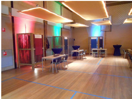
De opbouw van de startbijeenkomst.

Het plan wordt voor de zomer aangeboden aan de gemeente Wijchen en andere betrokken instanties.