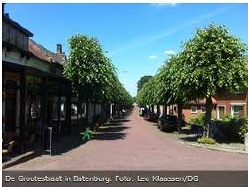
De Grootestraat in Batenburg.

BATENBURG - Het 'stadsontbijt' dat een jaar geleden in Batenburg is gehouden, krijgt een vervolg.