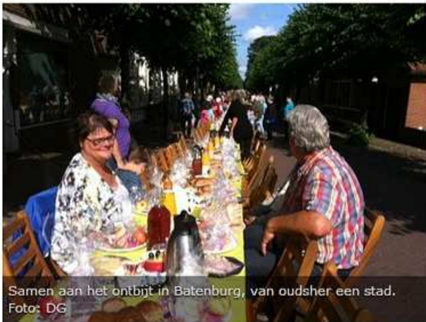
Samen aan het ontbijt in Batenburg, van oudsher een stad.

BATENBURG – Inwoners van Batenburg hebben zaterdagmorgen hun 2e stadsontbijt verorberd. Aan een tafel van 60 meter in de Grootestraat zaten 125 mensen aan voor een ochtendmaaltijd in de zon.